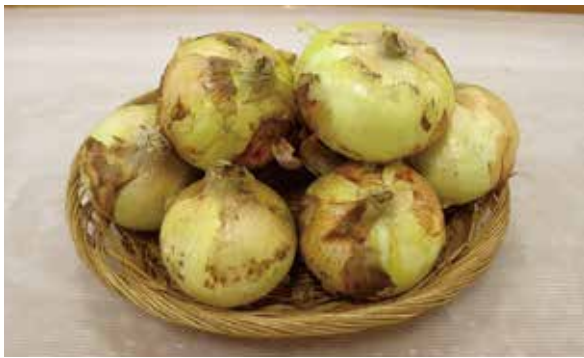
※価格は出荷時期で変動します。

サラダはもちろん、新玉ねぎのステーキなど素材の味を楽しめる調理法がおすすめです♪ ぜひ、ご賞味ください！