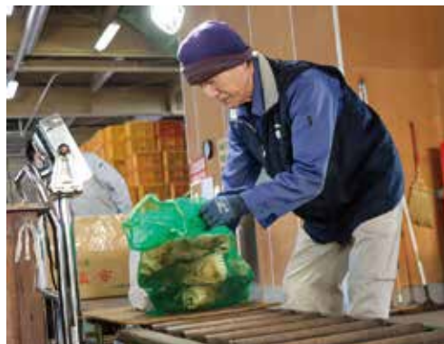
黄金孟宗を集荷する作業員。