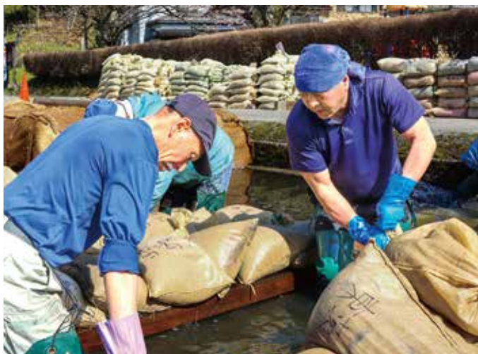
催芽施設で温泉の湯から種もみをあげる作業員。

湯田川催芽施設で、温泉の余り湯を活用した水稲の芽出し作業が4月下旬まで行われた。