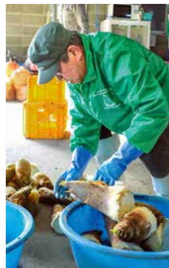
湯田川孟宗を選別する検査員。

「もんとあ〜る」には各地区の生産者が孟宗を出荷しており、旬の孟宗が店頭には並んでいる。