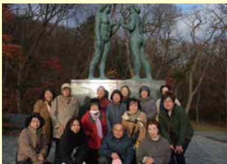
今年の会員研修では、青森県十和田市の直売所視察と函館観光を楽しみました。

もんとあ〜るでは、新規の出荷会員を募集しています。昨年度は約350人の正会員から出荷いただいております。約3人に1人は年間売上100万円以上、約7人に1人は200万円以上の売上があります。 小さな圃場しかなくても始められるのが特徴で「自家用野菜をいろいろ栽培していて、ちよっと多く採れたから産直に出してみようかな」というきっかけで会員になったところ、お客さんから「美味しかった」と言われるのが励みになり、次第に出荷品目を増やし、産直出荷が日課になった、という体験をよく耳にします。 農業には定年がないため、会社勤めを終わって就農する「定年帰農」の例もあります。もともと農地は所有しており、大規模経営はできないけれど、品目を絞って作付けし、サラリーマン時代の経験を活かして、今年売れた品目、売れなかつた品目、店で品薄な品目などを分析して次年度に繋げており、日々の農作業が健康維持にも繋がっているということでした。 他にも、共販主体の営農体系の中、一部の品目や時期のみ産直出荷に取り組む例や「毎年の家族旅行代金」など目標を設定して出荷されている方もいます。