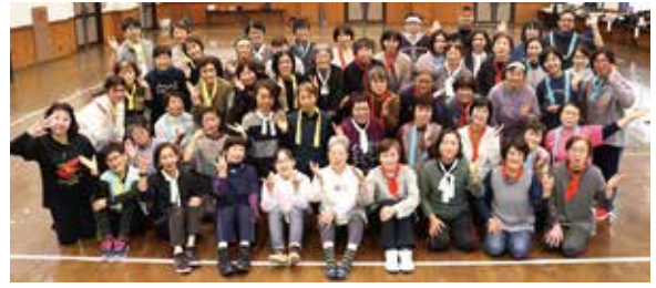
みんな楽しく身体も心もポカポカに!