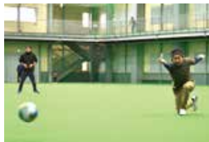
狙いを定めて投球