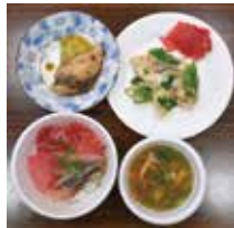
完成した料理の数々