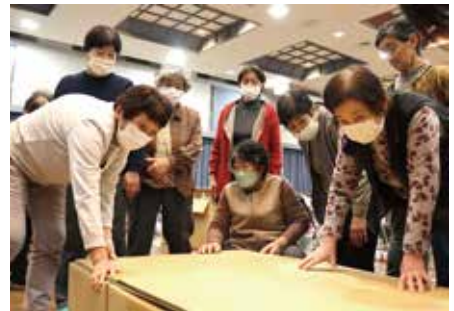
段ボールベット組み立て中