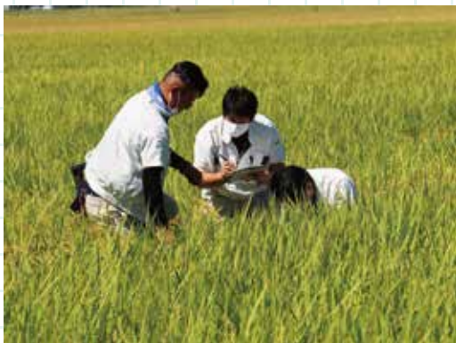
生育状況を確認する耕種指導係