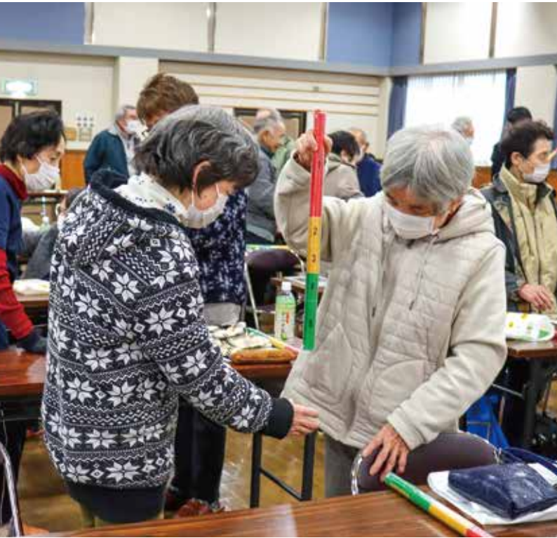
ゲームで反射神経をチェック!