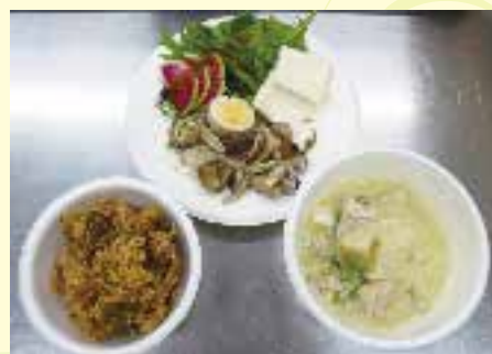
おいしい4品ができました♪