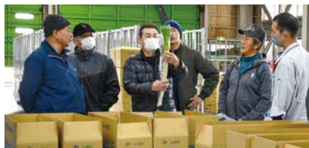
出荷規格を確認する生産者。