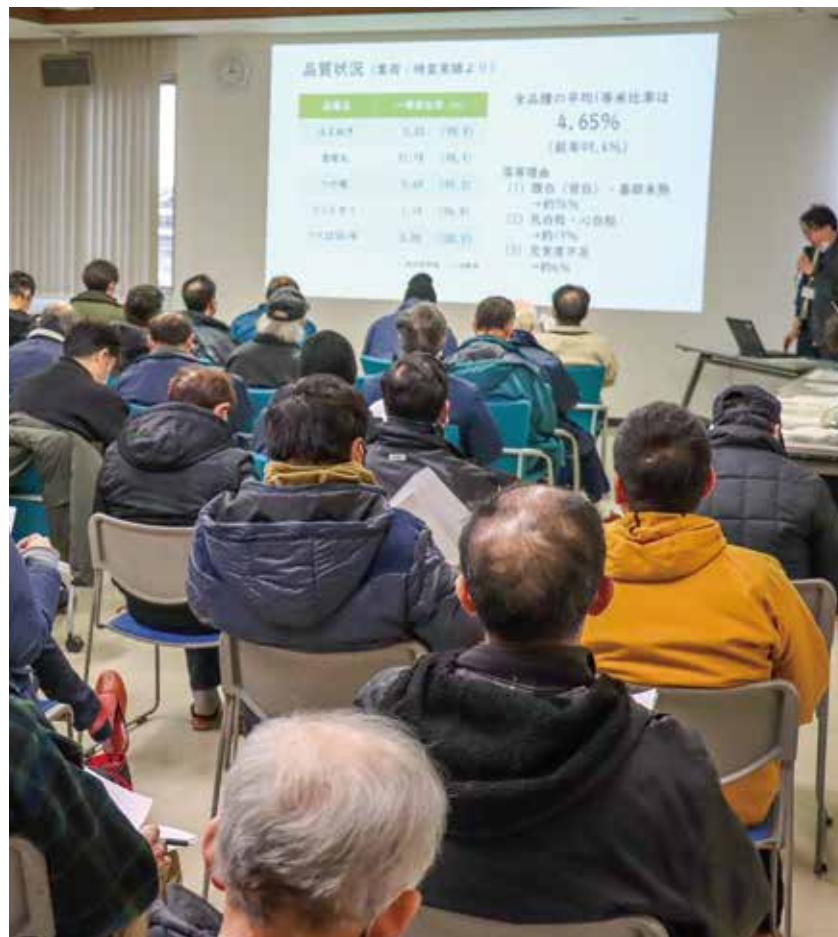
耕種指導係から説明を受ける参加者。