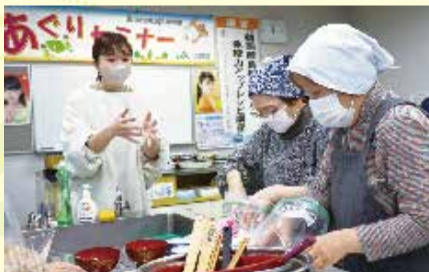
塩こうじ作りに挑戦!

に、市民16人が参加し、「鶴岡産食材を使った免疫力アップレシピ講座」をテーマに調理実習を行いました。実習では塩こうじ作りと、「酒かす塩こうじスープ」や「キノコ塩こうじ蒸し」、ただちや豆フリーズドライを使用した「しょうゆこうじただちや豆ごはん」などに挑戦しました。