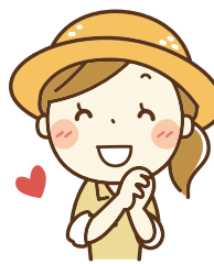
産直の売上で家族旅行をするDさん

子供には「新鮮」で「安全」な野菜を食べさせたくて野菜を作り、出荷したら、思った以上の収入に。これで家族旅行に行ってます。