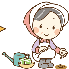
自家用野菜の出荷から始めたBさん

最初は自家用で色々育てていたけど、ちょっと多く採れたから産直に出荷したら、お客さんに美味しいねと言われて嬉しかったわ。