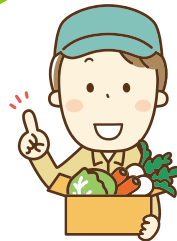
リスク分散を考える若手農家のCさん

サラリーマン時代の経験を活かし、今年売れた物や売れなかった物、また店で品薄だった物を分析し、次年度の売上に繋げてます。