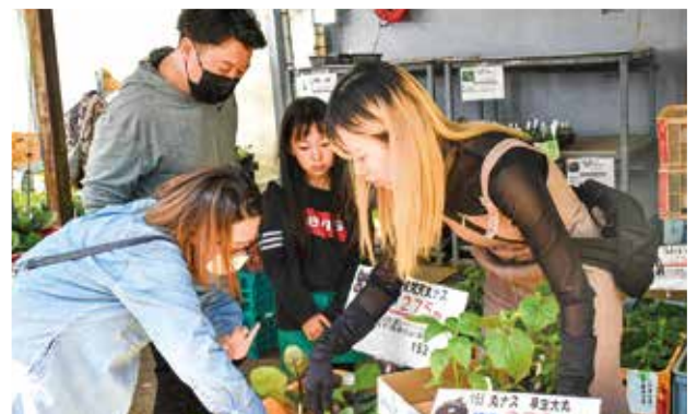
野菜苗を買い求める買い物客。

【営業時間】 ■苗 売 場 9:00 ~ 17:00 ■白山茶寮 9:00 ~ 16:30