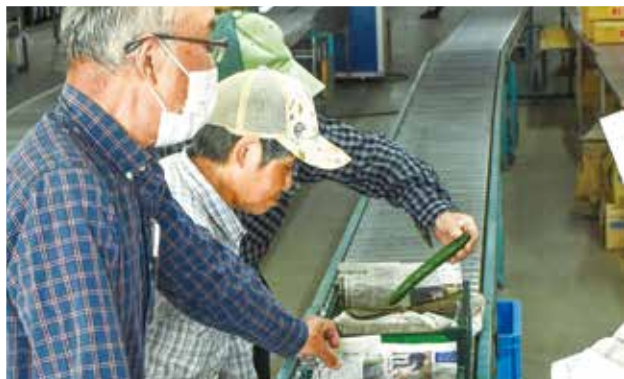
出荷サンプルを確認する生産者。

出荷は例年並みの5月5日から始まり、これから最盛期を迎える。出荷は7月中旬まで続く。