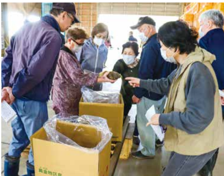
「黄金産孟宗」の目揃い会。

4月25日からは、「湯田川孟宗」の出荷が始まる。初日は生産者26人が、朝掘ったばかりの孟宗を次々と運び込み、約480 キ を出荷した。今年は5月25日まで集荷され、昨年の約6.5 ト より多い約17.6 ト の出荷となった。