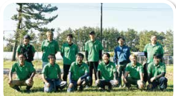
食と農の大切さを伝えた青年部員たち

次代を担う子どもたちに食と農の大切さを伝えることを目的に企画しており、今回で11回目になります。