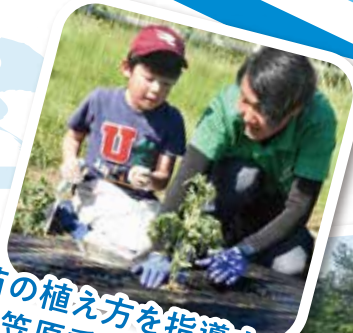
苗の植え方を指導する 小笠原委員長(右)