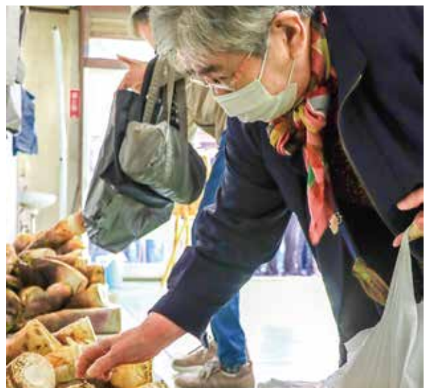
湯田川孟宗を選ぶ買い物客。