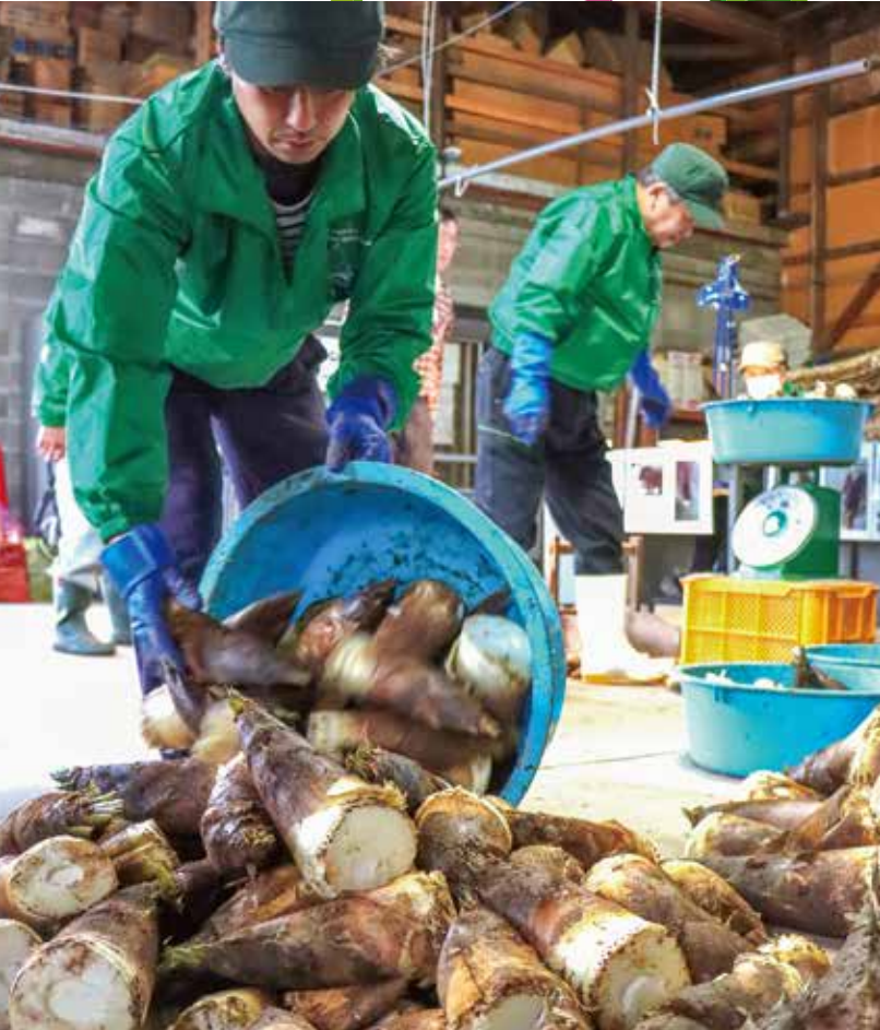
湯田川孟宗初出荷。