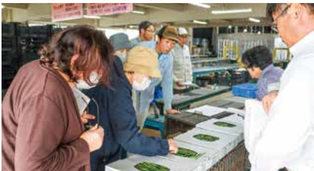
サンプルを確認する生産者。

抑制栽培のサイインゲンは同専門部で75人で栽培し、出荷は10月中旬にピークを迎え、11月下旬まで続く予定だ。