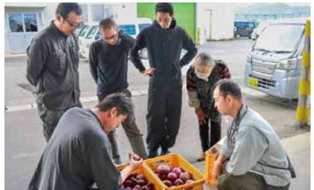
赤カブのサンプルを確認する生産者。

生産者13人が栽培し、山形県内の漬物業者を中心に約70トンの出荷を見込んでいる。出荷は11月以降に最盛期を迎え、12月中旬まで続く。