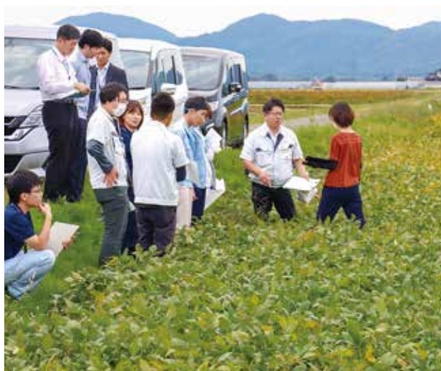
圃場で大豆の生育状況を確認。