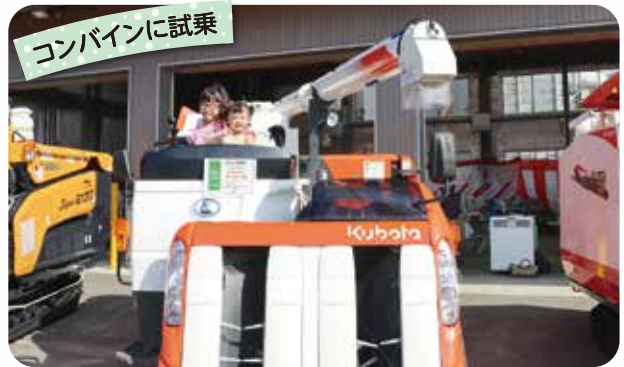
コンバインに試乗