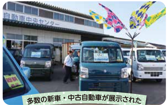
多数の新車・中古自動車が展示された

JA鶴岡は10月26日、鶴岡市白山地区の中央センター・農機センター周辺で秋のビッグフェア2024を開き、227戸の組合員家族が訪れました。 家電・生活品コーナーではエアコンや洗濯機といった家電製品、ガス器具、寝具などの商品を展示しました。農機センターではトラクターや田植え機、コンバイン、管理機などのさまざまな農機、中央センターでは新車・中古自動車を多数