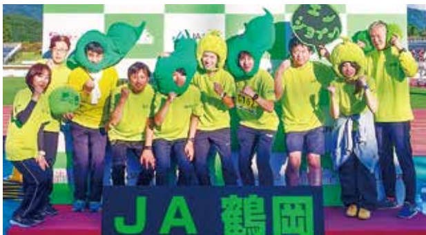
JA鶴岡駅伝チーム頑張ってきました!

「JA 鶴岡駅伝チーム」は9月に行われた西郷地区駅伝徒競走大会や大泉地区駅伝大会にも参加し、組合員や地域住民との交流も深めている。