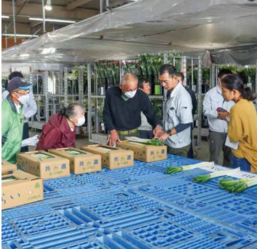
長ネギのサンプルを確認する生産者。

出荷は11月中旬にピークを迎え、12月中旬頃まで予定されており、4000箱の出荷を見込んでいる。