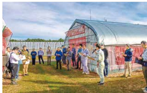
遮光資材の効果を説明する産地研究室職員。