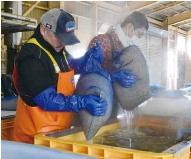
種子袋を温水より引き上げる作業員。

同育苗組合は、農薬を使わない温湯消毒を12年より開始した。大泉CEが取り扱うつや姫は、全量温湯消毒を行い安全安心の米生産に向けて取り組んでいる。