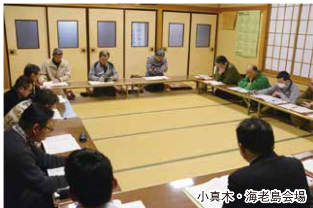
小真木・海老島会場

いては、生産組合員の減少と変化により、その役割発揮が困難な場合もあり、集落組織の機能維持・再構築はJ Aとしても重要課題と認識しております。