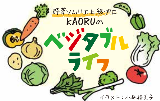
イラスト：小林裕美子